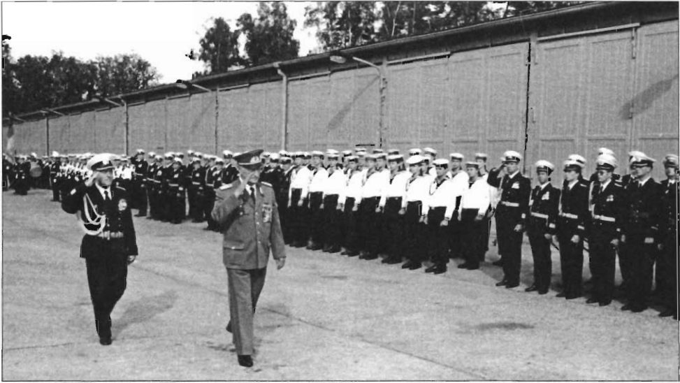
Verleihung eines Ehrenbanners des ZK der SED durch den Minister für Nationale Verteidigung 1989 (JD)