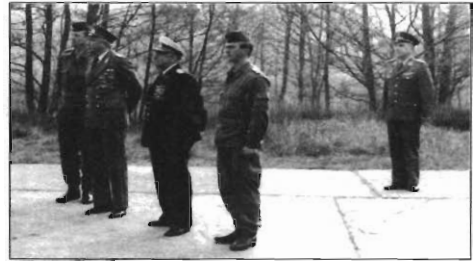
Minister für Nationale Verteidigung, CVM, Kommandeur des KRR-18 und der Kommandeur der 1. KRA (LS)

Vorgesetzten die anderen schon hatten. Der große deutsche Politiker Bismarck unterschied drei Klassen von Orden: Die erdienten, die erdinierten und die erdienerten. Das galt wohl auch für die VM, man kann es aber auf keinen Fall verallgemeinern. So trugen bestimmte Offiziere im Stab der VM eine bedeutend umfangreichere Ordensspange an der Uniformjacke als die Kommandeure der Verbände, Truppenteile und Einheiten. Die trugen dafür im Ausgleich eine erheblich größere Verantwortung. Auch dafür gibt es ein Sprichwort: Orden und Bomben fallen immer im Hinterland und treffen meist Unschuldige.