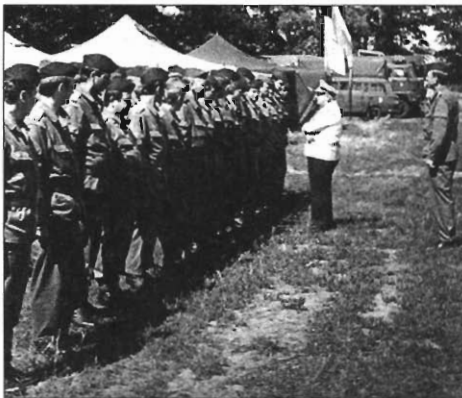
Musterung des Personalbestands im Feldlager beim 4. RSA 1987 durch den CVM (LS)

Am 01.12.1987 wurde Admiral W. Ehm in den Ruhestand versetzt. Sein Nachfolger wurde, wie allgemein erwartet, sein Stellvertreter und Chef des Stabes, VA Theodor Hoffmann. Aufgrund seiner hohen Sachkenntnis, durch sein korrektes Auftreten und weil er sich tatsächlich um alles kümmerte, genoss er bei den Angehörigen der VM großes Ansehen. Außerdem war er bekannt für sein konsequentes Verhalten und