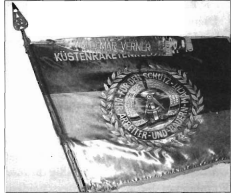
Truppenfahne des KRR-18 (PG)

Für das KRR-18 können wir bezüglich der Struktur, Organisation und Führung zwei Entwicklungsphasen unterscheiden. Die erste beginnt mit der Indienststellung und umfasst die ersten sechs Jahre. Die zweite ist das letzte Jahr vor der Auflösung der DDR und der VM. Dieses letzte Jahr war geprägt durch die erst schleichende, dann offene Aufweichung der NVA. Da man in dieser Lage nicht mehr von einer normalen Struktur, Organisation und Führung des KRR-18 sprechen konnte, behandeln wir hier deshalb nur die ersten sechs Jahre seiner Existenz. Das KRR-18 war bei seiner Indienststellung das einzige Regiment der VM. Die Bezeichnung Regiment stammt von den Landstreitkräften und ist für die Marine nicht typisch. Später kamen das Nachrichtenregiment 18 und, erst kurz vor der Auflösung der NVA, das Küstenverteidigungsregiment 18 dazu, wobei nur unser Regiment zu den Stoßkräften der VM gehörte.