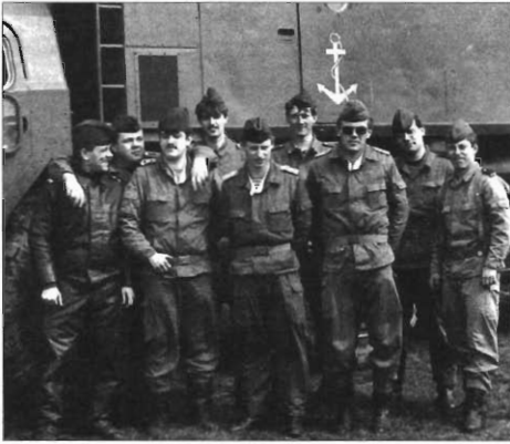
Angehörige der 1. KRA kurz vor der Auflösung der NVA 1990 (PG)

Schwarz stammte aus der RTA 6 der RD der 6. Flottille und hatte danach in der KRA-18 und im Regiment als Stellvertreter des Abteilungskommandeurs gearbeitet. Er verfügte über ausgezeichnete Kenntnisse bezüglich der Raketentechnik und ihres Einsatzes, die er effektiv in der Praxis anwendete. Bis zur Auflösung des Regiments war er Kommandeur der 2. KRA.