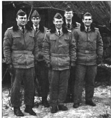
Der langjährige Stabschef des KRR-18 mit Offizieren des Stabes 1987 (WS)

Als Stellvertreter des Kommandeurs für Technik/Ausrüstung (STKT/A), später als Stellvertreter für Technik (STKT), arbei-