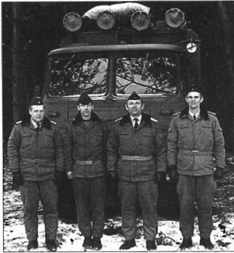
Letzter STKLPLA des KRR-18 mit seinen Mitarbeitern (WS)