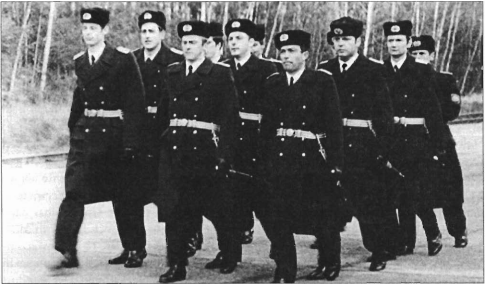
Führung der KRA-18 (UL)